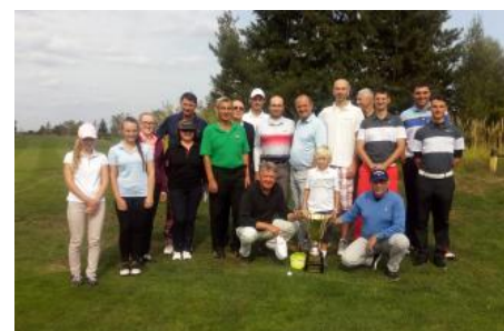
Vítězný tým GKL