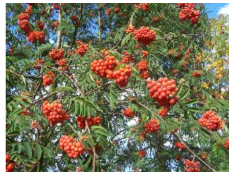
Plody a listy jeřábu ptačího

Jeřáb ptačí se často plete s jasanem ztepilým, protože má podobný vzhled listů. U jeřábu jsou jednotlivé laloky listů jen o málo menší a na opticky poněkud delším stonku trochu blíže u sebe.